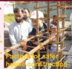
Factors for safer house construction

بہت سے مہیاں اور لوگ محفوظ رہیں۔ بہت سے مہیاں اور لوگ محفوظ رہیں۔ بہت سے مہیاں اور لوگ محفوظ رہیں۔ بہت سے مہیاں اور لوگ محفوظ رہیں۔