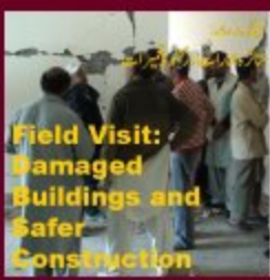
Field Visit: Damaged Buildings and Safer Construction

محفوظ تعمیرات کی ضرورت محفوظ تعمیرات کی ضرورت محفوظ تعمیرات کی ضرورت