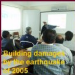
Building damages by the earthquake of 2005