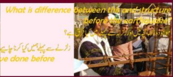
What is difference between the one structure before the earthquake? زلزلے سے پہلے ہمیں کیا کرنا چاہیے؟