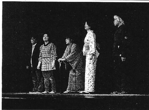
「唐桑ものがたり」を演じる出演者

気仙沼市唐桑町の郷土芸能を織り交ぜた町民劇「唐桑ものがたり」の家族の懐かしさや母親の認知症介護などの問題を抱えて一家離散した家族の物語。認知症の母親の実家が、唐桑を舞台に、家族間のドラマを繰り広げ、ばらばらになった家族が再会を果たして復活してきた唐桑の姿を熱演した。 出演したのは、崎浜、鮎川大漁唄込保、存会、小鮎神止り七福神舞保存会、唐桑浜屋、出船のシーンでは鮎川大漁唄い込み、カキ祭りに小鮎神止り七福神舞が登場。リストラ、うさげ、漁師になってきた父親が大しげからと話し。 町民有志でつくる劇団「夢の海」のメンバーで、総勢約1000人。唐桑地域の住民ら約370人が来場した。 劇は東京で書かれたが、父親のリストラや母親の認知症介護などの問題を抱えて一家離散した家族の物語。認知症の母親の実家がある唐桑を舞台に、家族間のドラマを繰り広げ、ばらばらになった家族が再会を果たして復活してきた唐桑の姿を熱演した。