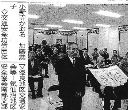
交通安全功労者の表彰

交通安全協会関係 交通安全協会功労者▽交通安全協会功労者 交通安全協会功労者▽交通安全協会功労者 交通安全協会功労者▽交通安全協会功労者 交通安全協会功労者▽交通安全協会功労者