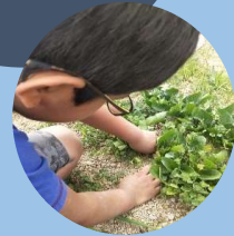
野菜収穫イメージ