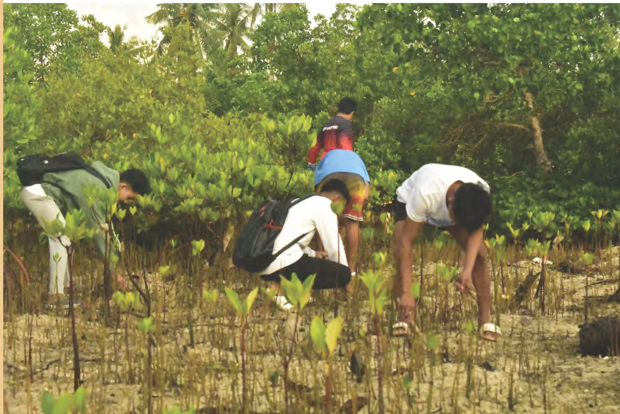
フィリピン教育省第7地方気候変動キャラバンの様子 (マングローブの植樹をする生徒たち) 【セブ / フィリピン】